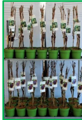
Potplanten en schalen met één soort/kleur per partij