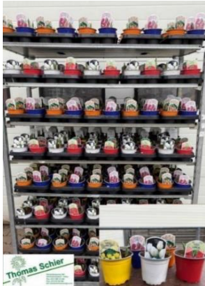
Potplanten op CC-containers